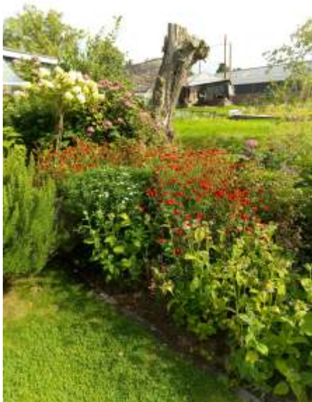
Tuin in Goudriaan